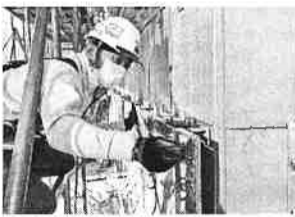
1階の外壁工事の様子

「1階部分の内外壁と、エントランス・ピロティー部分の床仕上げに石を採用。石は天然素材のため、ロットによって模様、色目が異なる場合があるが、今回は安定した同じ石目の素材を用意してもらえた。現場では使用用途、設計希望の色目、施工主のメンテ方法などによって採用する仕上げ方が変わってくることを実感した」